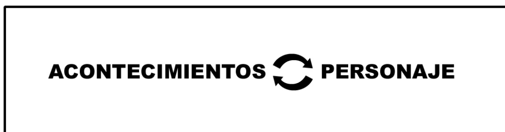
Cuadro 2.2. Los acontecimientos y los personajes según Bal.

unitaria el concepto de acontecimientos, sin nombrar las acciones o los sucesos. Se convierte por tanto en una transición de un estado a otro que un actor causa o experimenta y en referente de todo el proceso, como en Chatman ocurre con el suceso. Sin embargo, la definición de este último permite un mayor juego de análisis, por cuanto se puede relacionar con las diferentes acepciones que remarcan la pasividad o la actividad de los personajes. Por esta razón ha sido elegida la teoría del autor norteamericano sobre la de Bal, que se puede ejemplificar en el esquema siguiente: