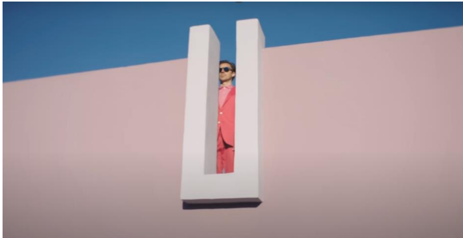
Figura 6. Martin Solveig. Do It Right (Official Video). ft. Tkay Maidza