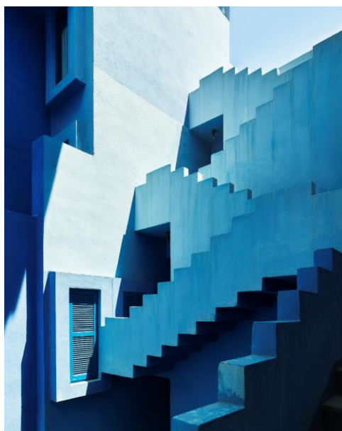
Figura 3. La Muralla Roja. 1968-1973. Calpe. Vista interior