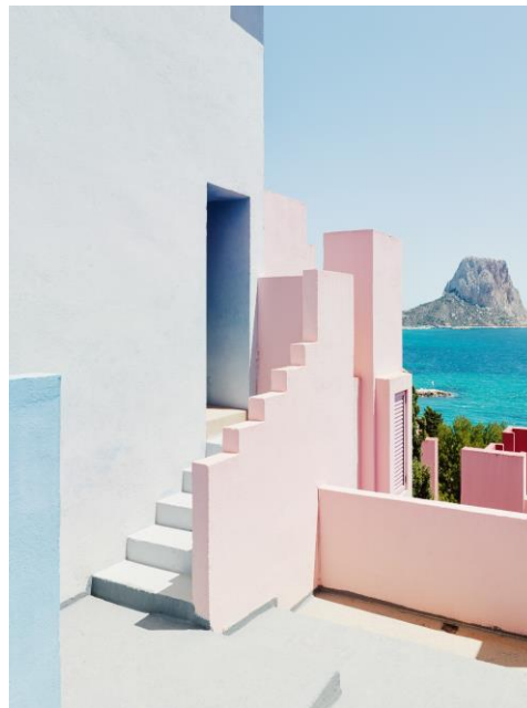
Figura 5. Ricardo Bofill. La Muralla Roja. 1968-1973. Calpe