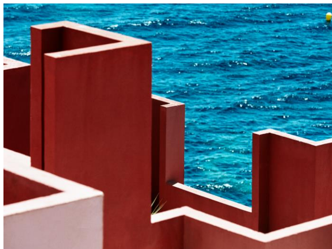
Figura 2. La Muralla Roja. 1968-1973. Calpe. Vista de los acabados altos del edificio