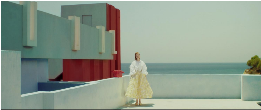
Figura 8. Delpozo. “DelPozo Spring Summer 2016”