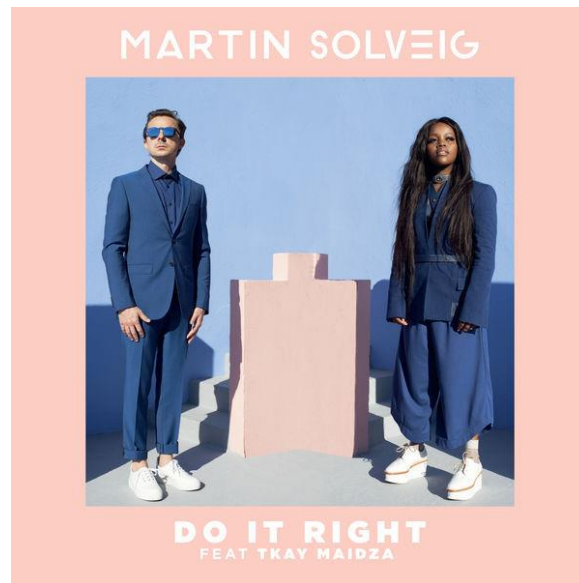
Figura 9. Portada del disco, Martin Solveig Feat Tkay Maidza - Do It Right. Discogs

Fuente: KOPG, s.f., recuperado de https://bit.ly/3Hz7CFS