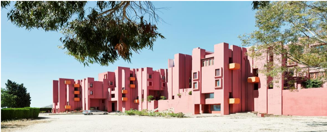
Figura 1. La Muralla Roja. 1968-1973. Calpe. Panorámica del exterior de La Muralla Roja