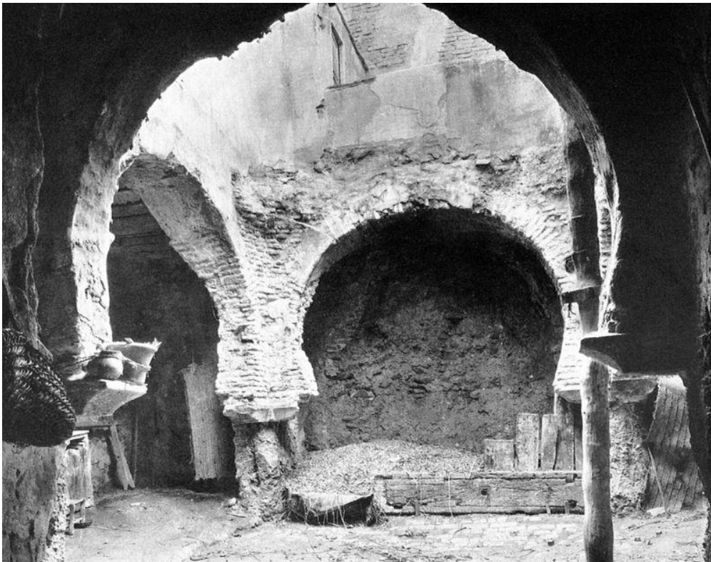
Baños árabes en Calle Madre de Dios, h. 1907.