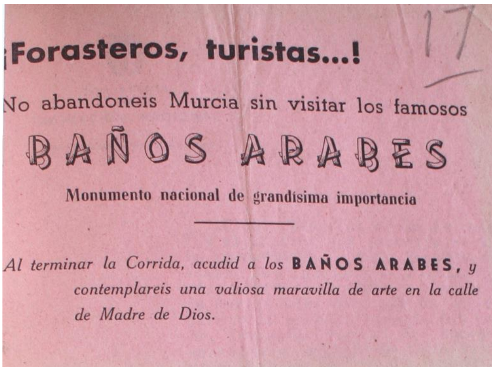
Octavilla invitando a visitar los baños, 1952.