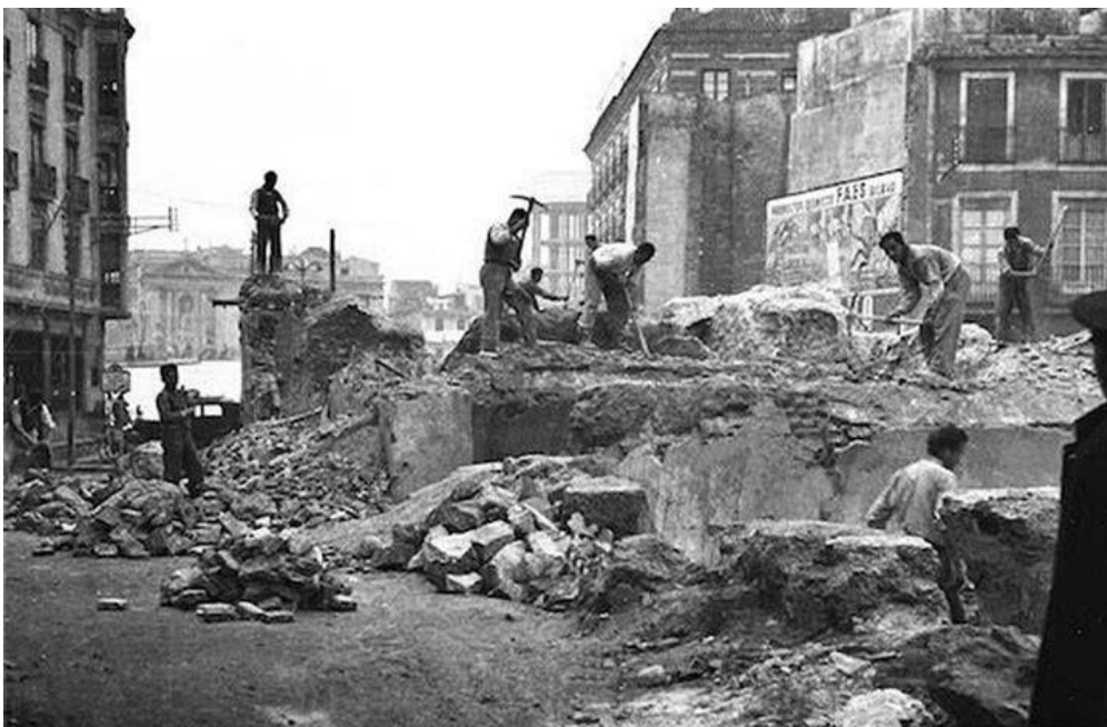
Dstrucción de los baños árabes, 1953.