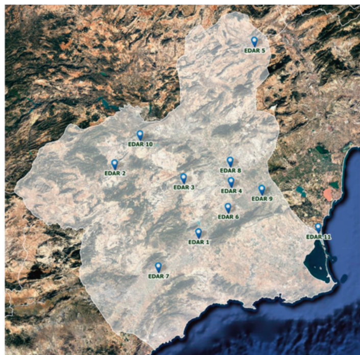
Figura 2. Mapa de localización de las Estaciones Depuradoras de Aguas Residuales (EDAR) analizadas.

Los resultados de los análisis de las muestras recolectadas fueron suministrados por ESAMUR. La metodología empleada para los análisis explicada brevemente fue la siguiente: Las muestras fueron recogidas y conservadas a 4°C hasta que fueron procesadas en el laboratorio (antes de que transcurrieran 24 h desde su recogida). En el laboratorio se les añadió una cantidad conocida de patrones internos para mantener la trazabilidad de los análisis y se filtraron antes de proceder a su análisis. Se realizó una extracción en fase sólida (SPE) de los antibióticos objeto de estudio. Para ello se usó un sistema de preconcentración "on line" junto con diferen-