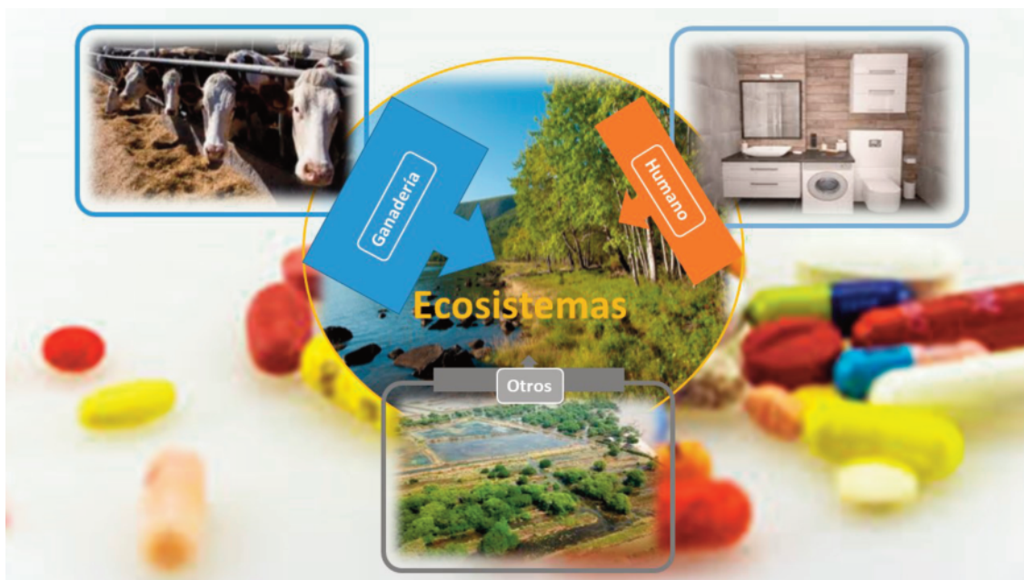
Figura 1. Diagrama de las principales fuentes de entrada de los antibióticos a los ecosistemas.

Figure 1. Diagram of the main antibiotic sources into the ecosystems.