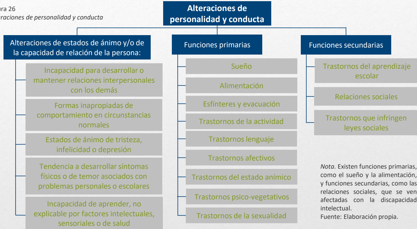
Figura 26 Alteraciones de personalidad y conducta