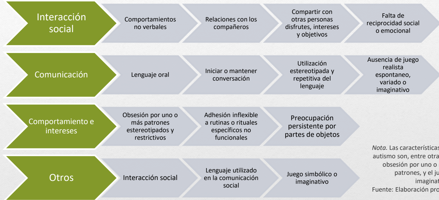
Figura 28 Autismo

Nota. Las características del autismo son, entre otras, la obsesión por uno o más patrones, y el juego imaginativo.