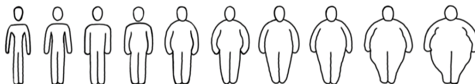
Figura 1. Imagen corporal.