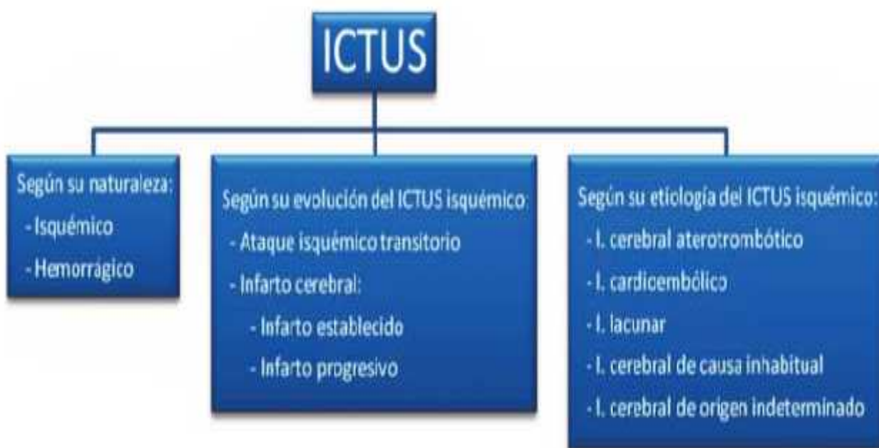
Figura 3.1. Clasificación del ictus

Atendiendo a su naturaleza, evolución o etiología, el ictus lo podemos clasificar en tres grandes apartados. 27 En la figura 3.1 mostramos la clasificación del ictus.