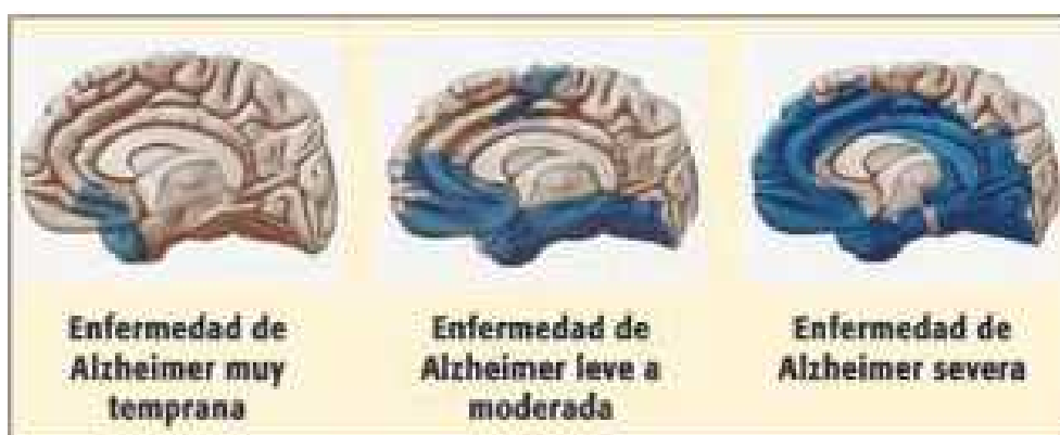
Imagen 3.2. Evolución cerebral de la enfermedad de Alzheimer

La enfermedad del Alzheimer es una enfermedad neurodegenerativa progresiva, de lenta evolución e irreversible, que constituye la causa más frecuente de demencia entre las personas mayores. Afecta al cerebro humano en su totalidad, ocasionando una lenta destrucción y atrofia de la corteza cerebral, siendo las áreas asociativas corticales y parte del sistema límbico, donde se albergan las funciones cognitivas superiores, las más afectadas. 5,18