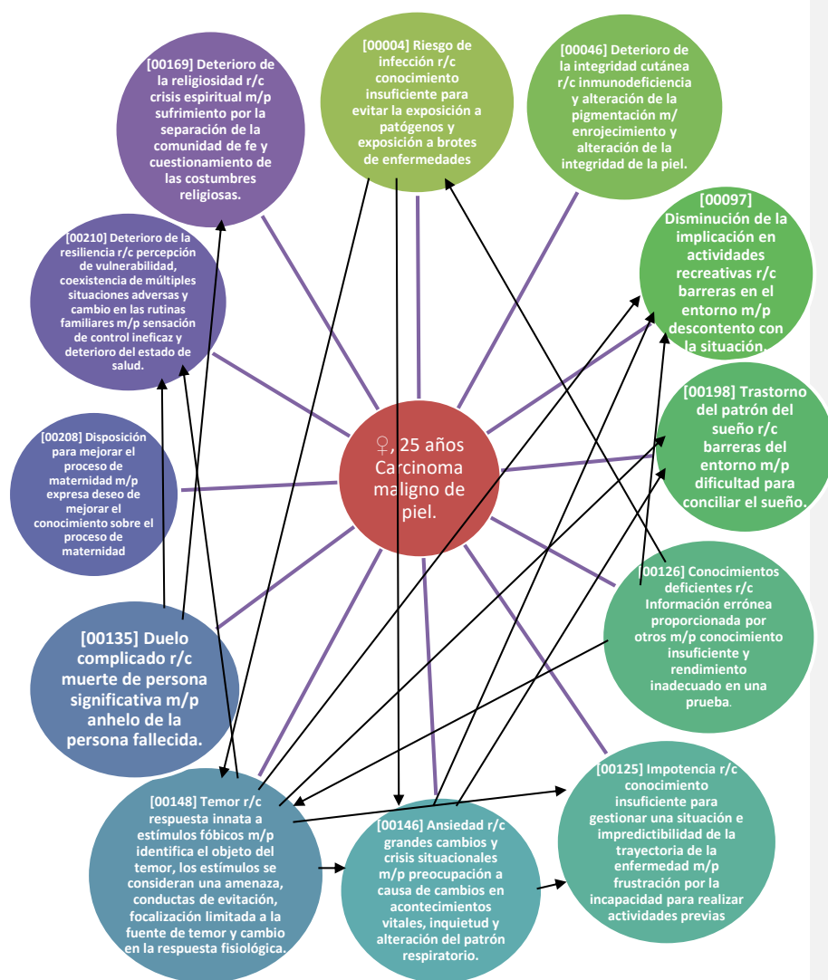
Figura 1: Red de Razonamiento Crítico para obtener el DxEp. Elaboración propia a partir de NANDA I, Herdman et al., (2019).