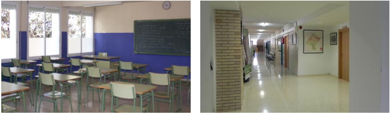
Figura 1. Imágenes de un aula y del pasillo del IESO Carcastillo.

Los espacios destinados a la formación en el IESO de Carcastillo junto con su aula de plástica invitan a pensar en el enfoque tradicional de las artes plásticas como un mero elemento decorativo y no como un elemento transformador. Así, los espacios comunes del centro no pueden ser usados y se proyecta al alumnado la idea de obediencia y silencio durante las 8h que dura la jornada lectiva. Esto sin duda, contradice las teorías expuestas en los puntos 2.5 y 2.6. Así, las herramientas actuales desarrolladas, presentan un margen de mejora mediante otros enfoques.